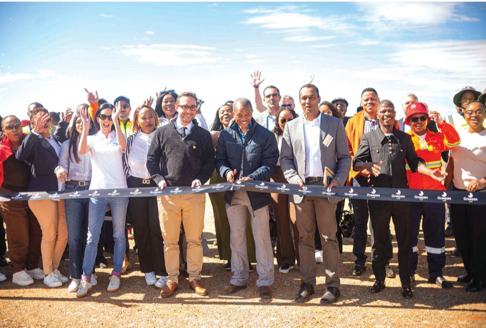
ENGIE Suid-Afrika het die Graspan Sonkrag PV-aanleg in die Noord-Kaap amptelik ingewy, wat ‘n belangrike mylpaal is vir ‘n projek wat reeds sedert vroeg vanjaar in kommersiële bedryf is en nou bydra tot die land se elektrisiteitsvoorsiening.

digheidsontwikkeling en langtermynbelegging in gasheerge-meenskappe om beide energiesekuriteit en sosio-ekonomiese ontwikkeling te ondersteun.