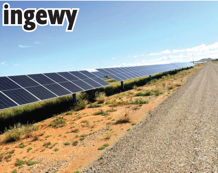
Graspan Sonkrag PV-aanleg is in die Siyancuma Munisipaliteit geleë. Dit is ‘n plaaslike munisipaliteit binne die Pixley ka Seme Distriksmunisipaliteit, in die Noord-Kaap.

Daar word ook verwag dat die projek deurlopende ekonomiese voordele sal lewer, insluitend plaaslike verkryging, vaar-